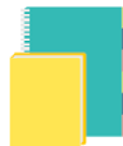
1 agenda ou cahier de textes (en fonction du cycle)