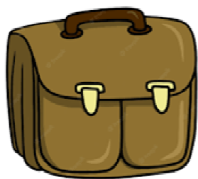
1 cartable ou sac à dos