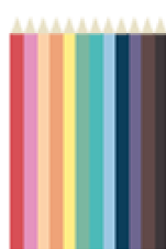
12 crayons de couleur