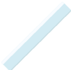
1 règle plate en plastique