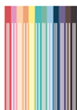
12 feutres de couleur