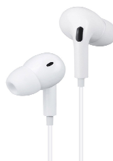
Des écouteurs filaires compatibles USB ou jack