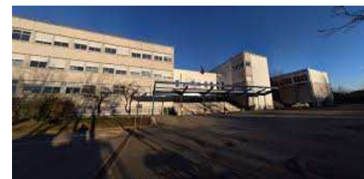
le lycée Augusto Monti de Chieri